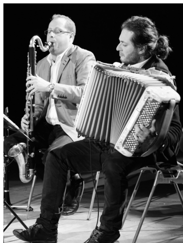
Milano 24 marzo 2013